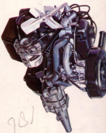
Krachtige en zuinige 1000 cc 62 P.K. motor

2-deurs sedan of 2-deurs stationwagen; vierpersoons met verstelbare gescheiden voorzittingen; volledig bekleed met kunstleer; binnenspiegel, veiligheidsglas rondom; asbakken voor en achter; bevestigingspunten voor veiligheids gordels voor; bij stationcar volledig in bolans opgehangen achterklep; dashboard met stootranden.